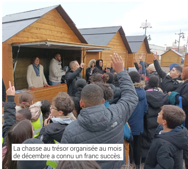
La chasse au trésor organisée au mois de décembre a connu un franc succès.