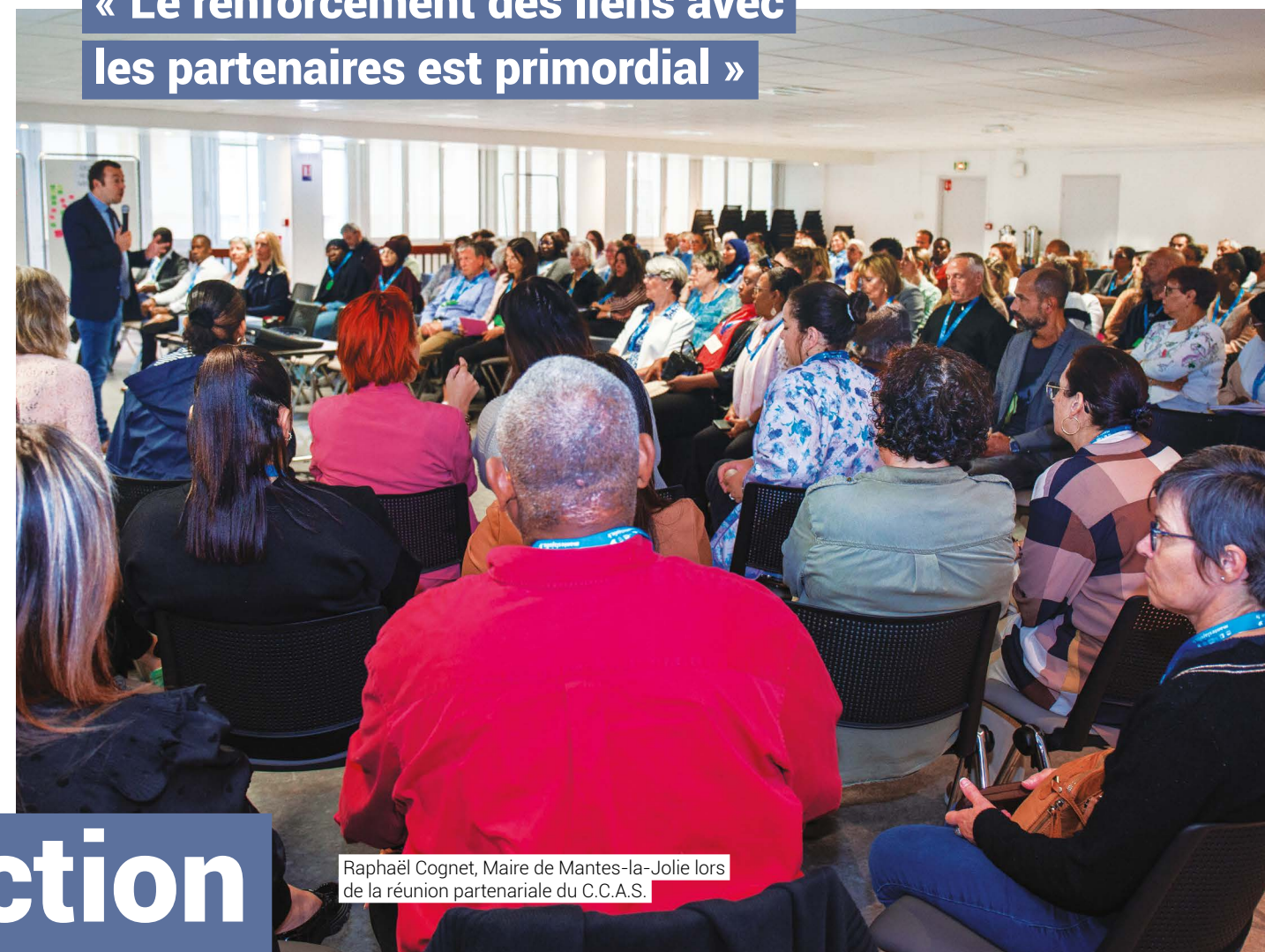
Raphaël Cognet, Maire de Mantes-la-Jolie lors de la réunion partenariale du C.C.A.S.