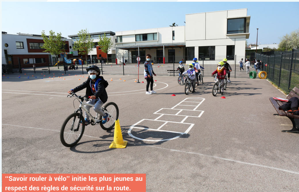
"Savoir rouler à vélo" initie les plus jeunes au respect des règles de sécurité sur la route.