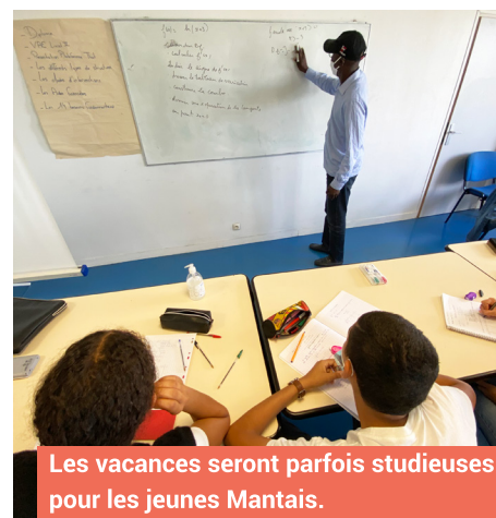
Les vacances seront parfois studieuses pour les jeunes Mantais.