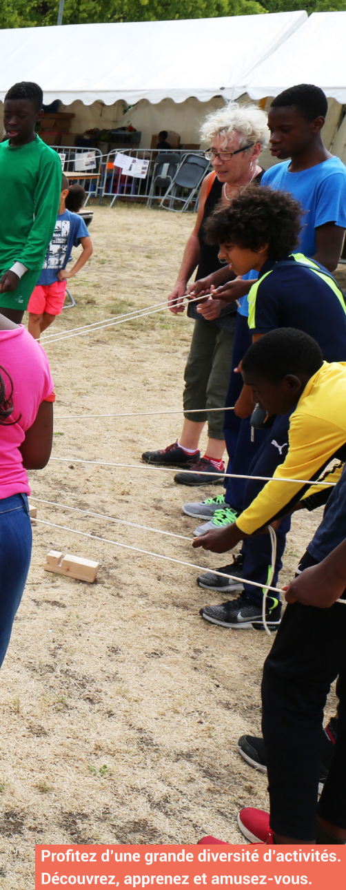
Profitez d'une grande diversité d'activités. Découvrez, apprenez et amusez-vous.